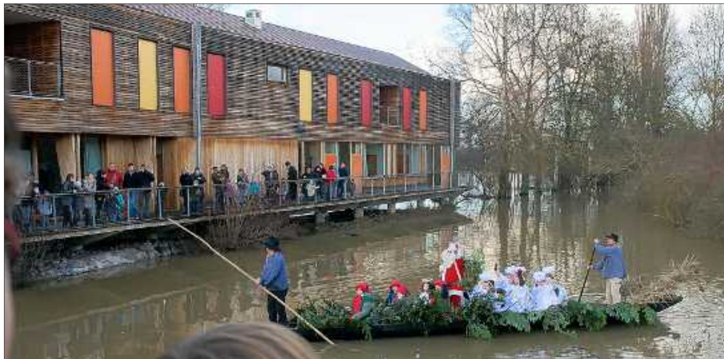
Le Père Noël et ses angelots ont été fidèles au rendez-vous hier à Muttersholtz.