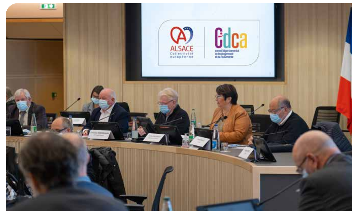
Installation du Conseil départemental de la citoyenneté et de l'autonomie Alsace – 9 novembre 2021 à Colmar