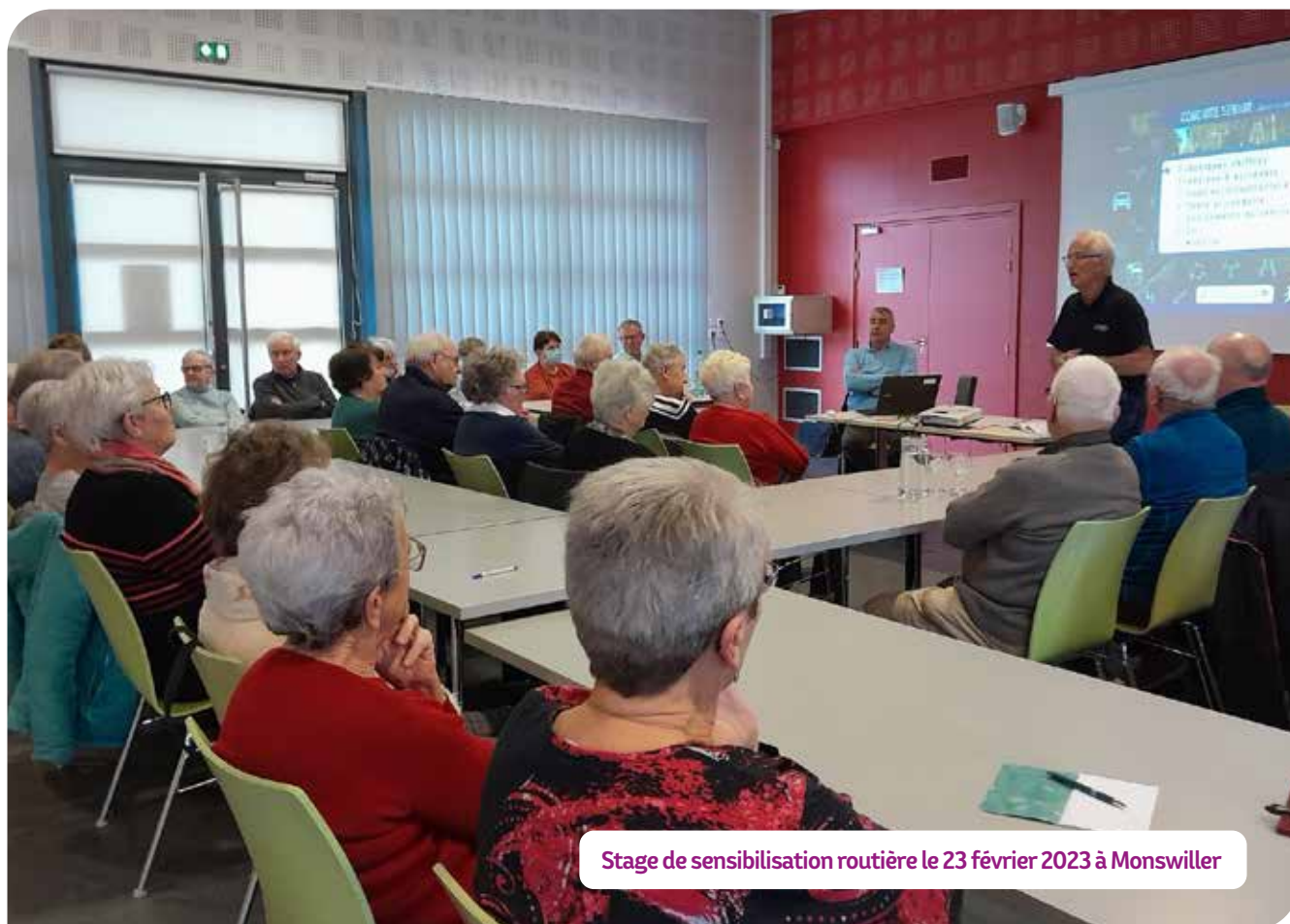
Stage de sensibilisation routière le 23 février 2023 à Monswiller

Association Prévention Routière 14 rue du Maréchal Juin - Cité Administrative 67084 Strasbourg Cedex Tél : 03 88 36 78 97 - 07 86 93 94 88 Courriel : comite67@preventionroutiere.com